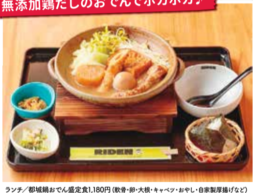
ランチ/都城鶏おでん盛定食1,180円(軟骨・卵・大根・キャベツ・おやし・自家製厚揚げなど)

朝びき直送の宮崎ブランド鶏ガラと数種の野菜を煮込み、北海道産昆布などと合わせた鶏だしおでん。お得なランチの他、夜はおでんとも焼き、鶏刺し盛など全7品に2時間飲み放題付きの「宴コース(1人4,000円) ※3名~前日までの要予約」が好評。夜限定定食もぜひ。