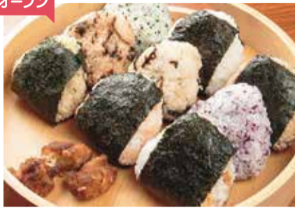
おにぎり各種200円、唐揚げ(2個入り)180円

県産米「ひのひかり」を使用したおむすび専門店が10/15オープン★18種の具材から選べ、注文後に握って提供。人気は、しっかり味のついた「肉みそ」やカリカリの梅がアクセントの「野沢菜梅ちりめん」。茶碗1杯分で食べ応え抜群♪ノンフライヤーで揚げたヘルシーな唐揚げも一緒にどうぞ!