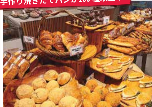
惣菜系やスイーツ系など幅広いラインナップ、各種162円~

店内で焼き上げたパンを手に取りやすい価格で販売。選ぶのも食べるのもワクワク楽しんでほしいと、どの時間帯でも種類豊富にそろえています。老舗の明太子を使用した「博多かねふくめんたいフランス」や「大きな自家製カスタードのクリームパン」などぜひ味わって♪