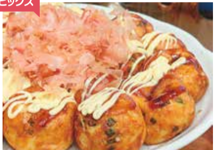
一番人気! 米粉たこ焼き(ソースマヨ)1パック6個入り550円

都城を中心に移動販売を行う米粉たこ焼きの専門店。昆布で丁寧にだしをとり、国産米100%使用の米粉や山芋、卵を合わせ銅板で焼き上げ。だしの風味と米粉のもちもち食感がクセになる一品です。一番人気のソースマヨ(550円)の他、ねぎマヨポン酢、わさびマヨ、のり塩(各650円)も♪