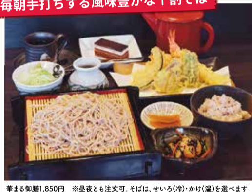
華まる御膳1,850円 ※昼夜とも注文可。そばは、せいろ(冷)・かけ(温)を選べます

北海道のそばの実を石臼でひき、毎朝手打ちする滑らかな十割そば。イチオシはそば、天ぷら、小鉢など品数豊富な「華まる御膳」。かつお・さば節や昆布などのだしに、関東のしょうゆを加えたキレのあるつゆも絶品です。「年越しそば(1人前/700円)」の予約受付中。