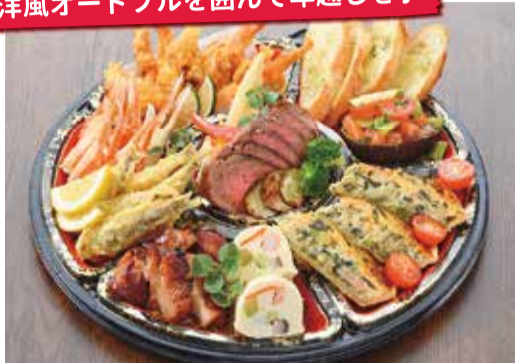
年末オードブル(3~4人前)8,000円 ※12/20までに要予約、12/31・13時~17時お渡し

昼は弁当販売、夜は「だれやみ」からコース料理まで楽しめる同店の人気料理がオードブルに! アンガス牛のローストビーフやタマネギとベーコンのキッシュ、北浦直送のメヒカリのビール揚げなど、8種の料理を盛り付け。また、ハンバーグやグラタン入りのクリスマス用も☆