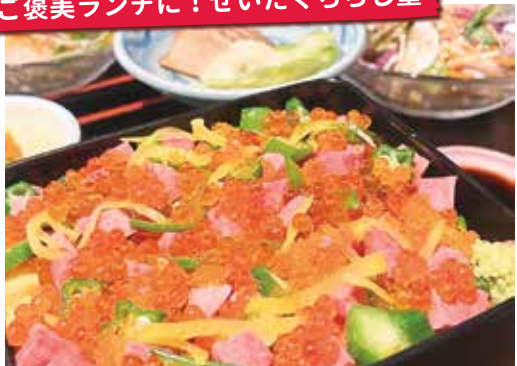
ランチ限定 牛トロチラス重2,300円(小鉢3種、サラダ、汁物、デザート、コーヒー付き)

厳選素材を使用したカジュアルな和食が味わえる居酒屋。昼限定の「牛トロチラス重」がイチオシ! 白ご飯の上に、サシと赤身のバランスが抜群の黒毛和牛のローストビーフやダシのきいた卵焼き、イクラ、トピコなどを彩りよく盛り付け。見た目や食感も楽しめるお重に舌鼓を。