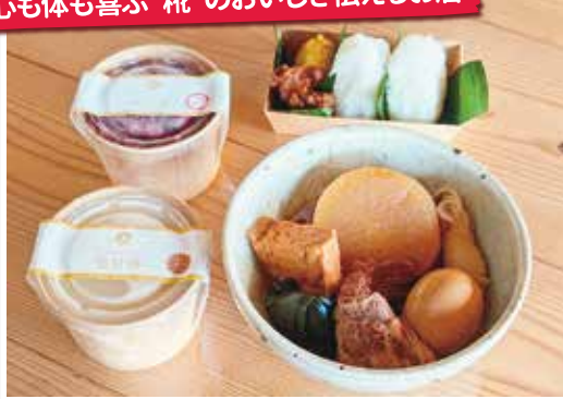
糎おでん(1セット)669円、かまど炊きごはんの塩むすびセット432円 ※テイクアウト価格

苗作りから精米まで自社で一貫して行い、その米を使った米こうじの製造から加工、販売までを手がけるお店。生甘酒はプレーン、古代米など5種類を冷凍販売(各583円)。3月初旬まで生甘酒としょうゆこうじを使った「糎おでん」を土日限定で販売。新米塩むすびもぜひ。