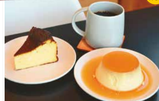
チーズケーキ450円、低糖質プリン400円、コーヒー400円

スポーツジムに併設するカフェがリニューアル★健康的に、罪悪感なく食べられるスイーツを中心に提供。人気のプリンは、自然由来の砂糖を使用し、糖質やカロリーを大幅に抑えた一品で、とろける食感が◎。この他グルテンフリーのチーズケーキなど手土産にもお薦め。