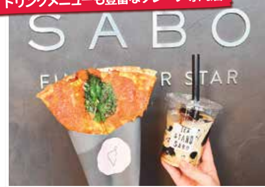
クレープ/大葉香るクリームチーズ750円、SABOブレンドジュレ580円

アーモンド粉を入れてカリッと香ばしく焼いたクレープが話題(17種/550円～)。イチオシは爽やかな大葉とハム、とろけるクリームチーズが相性抜群の一品。豆からひいたコーヒーで作ったジュレとリッチな生クリームを合わせた、ほろ苦い大人味のドリンクも一緒にどうぞ。