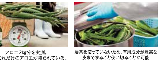
アロエ2kg分を実測。1瓶にこれだけのアロエが搾られている。 農薬を使っていないため、有用成分が豊富な皮までまるごと使い切ることが可能

69年前、鹿児島島の土地を耕しアロエを苗付けする所からアロエ本舗は始まった。もちろんアロエへの愛着はひとしお。この生ジュースも、自社農園で収穫した3年完熟キダチアロエを使うこと、そして「薄めナシ」の100%原液であること、全部使えるように農薬を一切使わない。実はキダチアロエは皮に 有用成分が多いからだ。収穫した新鮮なうちに丸ごと搾汁し、防腐剤を入れないようにしている。さらにその生ジュースを全く薄めず瓶詰めしたところ、なんと必要となったアロエ生葉は驚きの2kg分。アロエを大切に思うからこそできたこの濃さがすっきり感に繋がり、今なお沢山のリピーターを生んでいる。