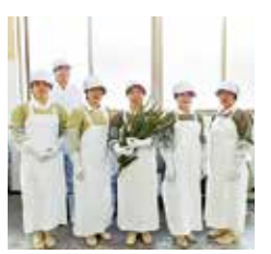
創業以来、地元女性が多く働く地場産業としても有名

日に何種類も色んなものを飲むようになってくると、できるだけで体に負担をかけたくないと思うことはないだろうか。高齢化の影響で「2年後、3年後が不安」という人が増えているが、最近ではその波に乗って売れ始めたものもある。創業69年のアロエ本舗(鹿児島市東開町)が作る「アロエ生ジュース」がそのひとつ。体の内側を守るアロエ特有の力が「健康のお供にピッタリ」と、中高年に人気だという。(制作者 泉美穂子) 残したい、アロエの力 アロエと言えば、母から子へ受け継がれる家庭の知恵だ。物が不足していた戦中戦後はこの庭先にもアロエがあって、何かあれば生葉をかじったり薬肉を塗ったりして、母の手当てを受けた。そんな アロエの力と温もりを残していきたいと、69年も鹿児島県アロエ栽培を続けているのがアロエ本舗株式会社だ。 不思議な売れ行き ところが最近、同社商品の売れ行きに不思議な事が起こっている。