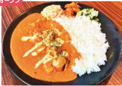
バターチキンカレー1,200円(副菜3品、サラダ、杏仁豆腐付き)

扉を開くとスパイスの香り広がる新店★15種類のスパイスを使用した「バターチキンカレー」が人気! スパイスに一晚漬けた鶏モモ肉と、たっぷりのトマトやタマネギをじっくり煮込み、バターでまろやかな辛さに仕上げています。ジャスミンライスと国産米のブレンド米で本格カレーを。