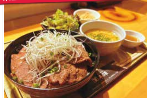
【ランチ】炭焼 ネギ塩牛タン丼セット1,480円

県産の赤身肉を中心に、国産鶏・豚肉の焼き肉を手頃な価格で。ランチは「炭焼 ネギ塩牛タン丼」の他、特製ダレに漬けて焼いた「炭焼 牛ハラミ丼セット(1,380円)」、ビビンバ、冷麺を提供。夜は「和牛もつ鍋コース(要予約・全6品/1人2,980円)」が人気。2時間飲み放題付き4,780円。