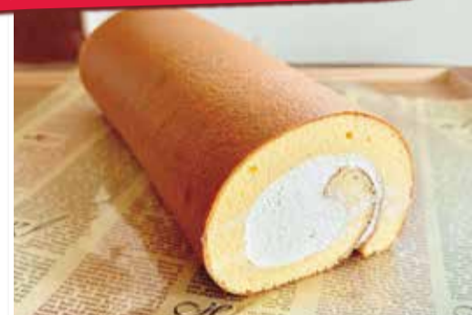
石窯ロールケーキ 雅(Miyabi)ロング(約24cm)2,500円、ハーフ1,300円

看板商品「石窯かすてら」を製造販売する菓子工房がリニューアル! 一番人気のロールケーキは、ふんわりしっとり食感で甘さ控えめ。こだわりの飼育法で育てられたニワトリの卵「康卵」などの厳選素材や、石窯のように焼けるオープンで焼き上げた生地が絶品。贈り物にも♪