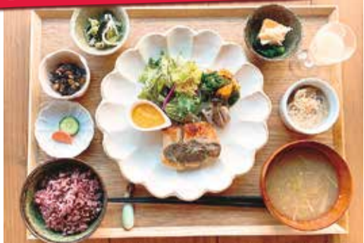
【月替わり】発酵ランチ1,738円、デザート&ドリンクセット2,255円 ※写真は過去の料理です

全ての料理に、食材や調理法に合わせた自家製の麹(こうじ)調味料を使用。県産の鶏肉や豚肉を使ったメイン料理のほか、綾町産の有機野菜や無農薬野菜たっぷり! 管理栄養士の店主がバランスよく味付けした、全13品を味わえます。「お腹の調子よくなる」と常連客の声も♪