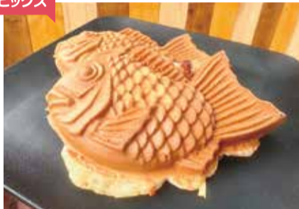
たい焼き「つぶあん」「とろとろカスタード」各250円

米粉と小麦粉で作るサクッとモチリ食感のたい焼きをキッチンカーで販売。生地にはきび砂糖やハチミツを使い、甘さ控えめに♪定番のつぶあん、カスタードに日替わりを加えた3~4種があり、注文を受けてから出来たてを提供します。幸せを願う店主の優しさが詰まったたい焼きをぜひ。